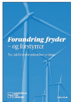
Forandring fryder – og forstyrrer Tæt på forandringsledelse i praksis