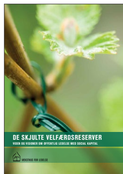
De skjulte velfærdsreserver Viden og visioner om offentlig ledelse med social kapital