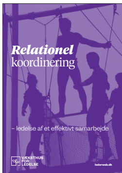
Relationel koordinering – ledelse af et effektivt samarbejde