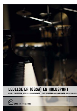
Ledelse er (også) en holdsport Fem kendetegn ved velfungerende ledelsesteam i kommuner og regioner

Alle publikationer kan hentes og bestilles gratis via lederweb.dk .