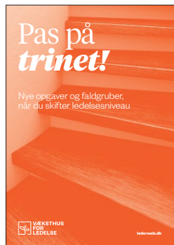
Pas på trinnet! Nye opgaver og faldgruber, når du skifter ledelsesniveau