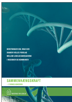
Sammenhængskraft – i virkeligheden Beretninger om, hvad der skaber fælles fodslag mellem ledelsesniveauerne i regioner og kommuner